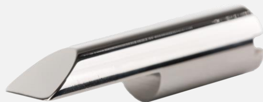
Couteau à bout plat Ø6 de 30°