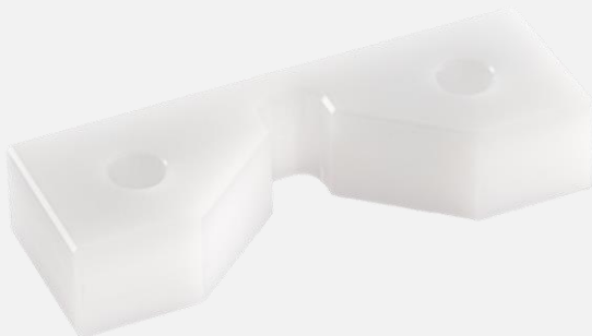
Appui de boîte standard (Ø20 à 40mm)